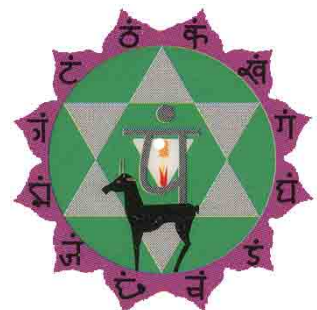
Mandala van het hartchakra

Hier is de overeenkomst tussen de kristalstructuur van een sneeuwvlok en de mandala van het hartchakra zichtbaar gemaakt.